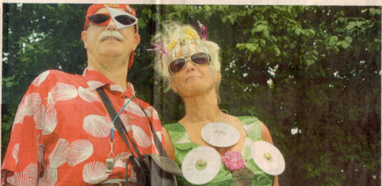
NEUGIERIGER UND AUFGESCHLOSSENER als je zuvor zeigen sich ältere Menschen heute. Die „Golden Oldies“ sind überdies nicht nur körperlich fitter als ihre Vorgänger, sie sind auch die reichste Generation, die je in Deutschland lebte. Reiten beispielsweise gehören für viele zur selbstverständlichen Freizeitgestaltung – sei es in den fernen Ozean oder, wie hier, zur Love Parade.

Damit die Senioren ihre Freizeit auch wirklich genießen können, bedarf es der berühmten zwei „G“: Gesundheit und Geld. Und in dieser Hinsicht haben die Älteren von heute gegenüber denen vor 20 Jahren deutlich die Nase vorn. Die „Golden Oldies“ sind nicht nur körperlich fitter als ihre Vorgänger, sie sind auch die reichste Generation, die je in Deutschland lebte: Das geschätzte Vermögen der über 60-jährigen beträgt rund 780 Milliarden Mark. Tendenz: steigend. Das Lebensgefühl älterer Menschen unterscheidet sich inzwischen nicht mehr so sehr von dem jüngerer. Untersuchungen ergaben, dass viele aus der „Plus-50-Genera-tion“ ein Vitalitätstempfinden haben wie die einstweilen Jahrzehnte jüngeren Zeitgenossen. „Wir haben keine Lust auf Abzugslohn geschoben zu werden“, sagt beispielsweise Walter Merk und spricht damit auch den anderen Mitbewohnern in der sonnenum-